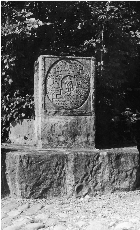
Der Stein in Bollingen.

Bild nach S. 240: Der Stein in Bollingen.