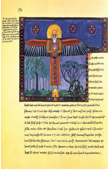
Elias – Philemon. Seite aus dem roten Buch.